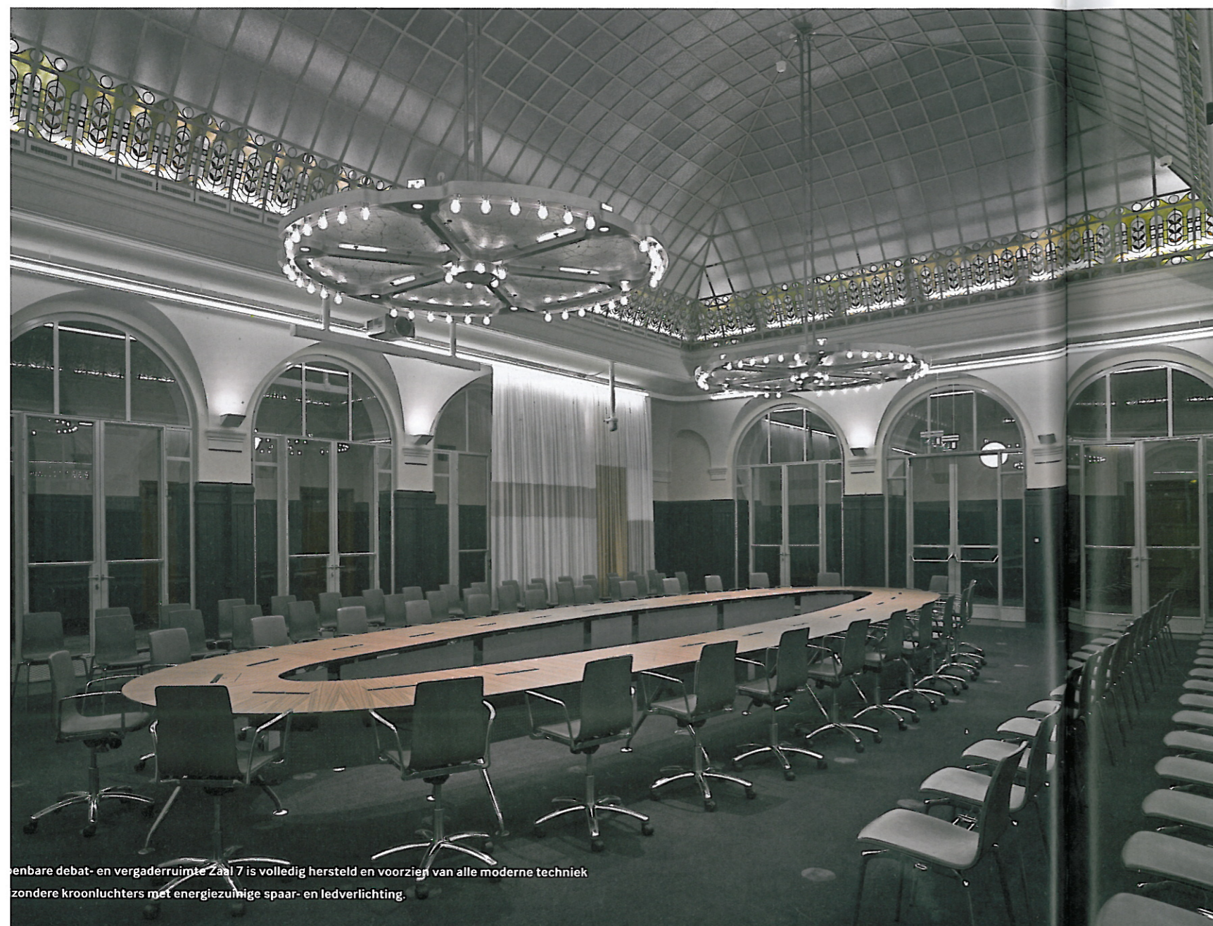
Openbare debat- en vergaderruimte Zaal 7 is volledig hersteld en voorzien van alle moderne techniek, waaronder kroonluchters met energiezuinige spaar- en ledverlichting.