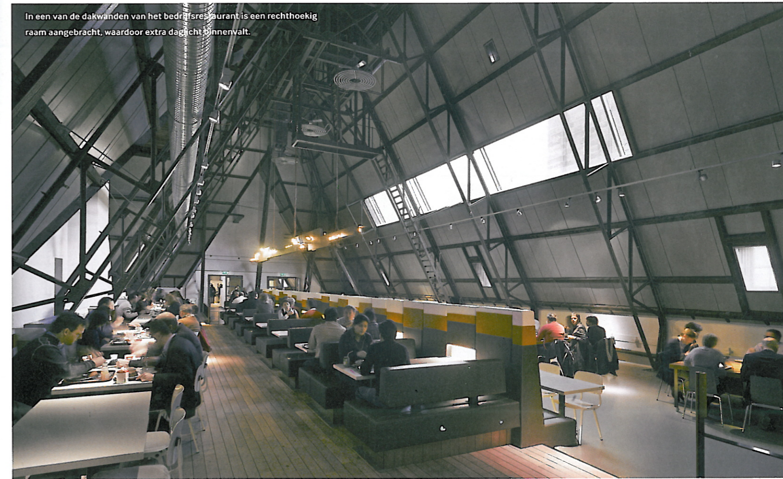
In een van de dakwanden van het bedrijfsrestaurant is een rechthoekig raam aangebracht, waardoor extra daglicht binnenvalt.