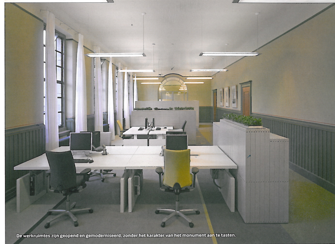
De werkruimtes zijn geopend en gemoderniseerd, zonder het karakter van het monument aan te tasten.

Opdrachtgever Ontwikkelingsbedrijf Rotterdam